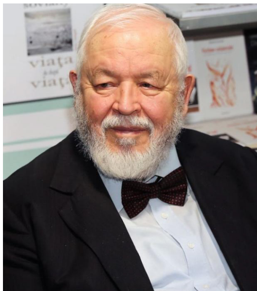
Foto nr. 1: Prof. univ. dr. Mihail Diaconescu (8 nov. 1937 – 25 mart. 2020)

Să spună în 1989 părintele Dumitru Stăniloae despre cineva că este „cel mai reprezentativ scriitor al spiritualității românești, începător al scrisului nostru viitor”, ne duce cu gândul la o personalitate cu o operă literară, istorică și filosofică de o anvergură istorică. De-a lungul timpului, a efectuat numeroase cercetări în biblioteci, a identificat numeroase descoperiri care au contribuit la zestrea culturală și la profunzimea evocărilor din adâncimea societății, din punct de vedere istoric, filosofic, religios.