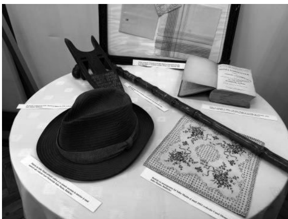
Fig. nr. 6 – Bastonul, pălăria și batista cu nomogramă ale lui Iuliu Maniu

Batista este proprietatea Ratiu Family Foundation și poate fi văzută la sediul Centrului creat de familia Rațiu, în Manchester Square din capitala Marii Britanii.” 19 (Foto. Nr. 7)