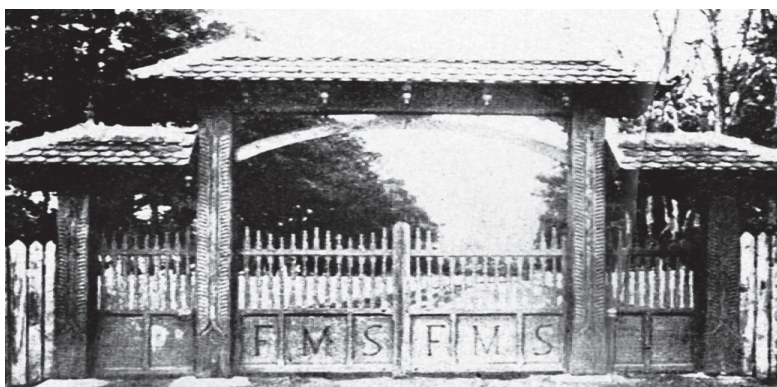
Fig. nr. 2 – Poarta principală de intrare în Ferma Agricolă Model Studina

7. să perfecționeze prin practică instruirea absolvenților școlilor agricole de diferite grade.