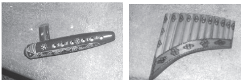
Fig. nr. 4 – Ocarină și nai (instrumente muzicale confecționate de Dumitru Domoș (Palanca, județul Bacău))

Pe lângă instrumentele muzicale, domnul Domoș Dumitru confecționa și figurine din lemn. Așezate pe o platformă de lemn rotativă câte două, țăran și țăranăcuță, respectiv mire și mireasă, dădeau impresia unui dans popular.