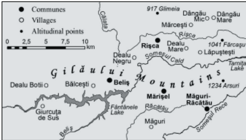
Fig. nr. 4 – Localități din Munții Gilăului în care etnia maghiară era reprezentată, în anul 1992, doar prin două persoane (tabelul 6).