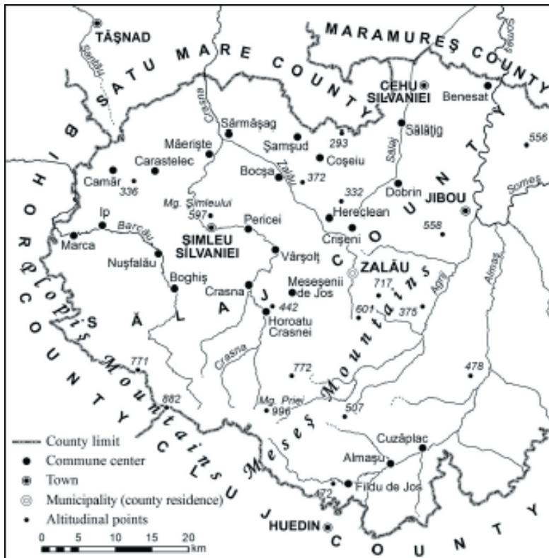
Fig. nr. 2 – Localități din Poarta Sălajului (județul Sălaj) și Depresiunea Almaș-Agriș, cu frecvența populației românești și maghiare (la aceasta din urmă de peste 10%), la recensământul din anul 2011.

Desigur, în modul cel mai firesc, maghiarii ajunși în Poarta Sălajului, care a constituit spațiul cel mai potrivit pentru a pătrunde în partea centrală a țării noastre, și-au continuat drumul către est, prin Podișul Someșan, în timp așezându-se, într-un anumit număr, în zonele Cluj, Dej, Huedin, Turda etc., după care, deplasându-se mai departe, au ajuns să cucerească întregul teritoriu al Transilvaniei.