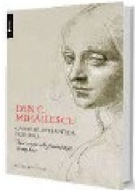
Fig. nr. 2 – Dan C. Mihăilescu, Castelul, Biblioteca, Pușcăria. Trei vămi ale feminității exemplare , Editura Humanitas, București, 2013, (Coperta)

ginală a ideii de feminitate: „o suită de imaginii ale României prin oglinda splendorii, suferinței și exemplarității feminine ipostaziată confesiv” 6 .