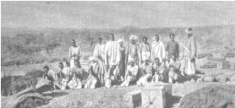
Fig. nr. 3 – Somali participanți la expediția prințului Dimitrie Ghika – Comănești, într-o pauză de odihnă în apropierea localității Hargheiza (Foto D. Ghika, din V. Tebeica, 1972. p. 200)

Am vorbit despre Somalia, se cuvin acum și câteva cuvinte despre somalezii. După Val. Tebeica [7], poporul somalez păstrează o unitate etnică și lingvistică. Face parte din grupul Kamit , deci sunt înrudiți cu berberii, cu unele populații nomade din Africa Occidentală și cu vechii egipteni. Pigmentul negru din pielea lor e înșelător, somalezii sunt apropiați de popoarele semite, atât prin trăsăturile somatice, cât și prin limba înrudită cu berbera și egipteana. După aceeași sursă, la sfârșitul secolului al XIX-lea existau peste două milioane grupate în numeroase triburi numite „ ner ” sau „ fakida ”. Se pot distinge cinci mari grupe: isașii, isakii, darazii, wavyii și sabii (ultimii în sud, în pământurile udate de Fluviul Leoparșilor și Fluviul Djuba, singurii care se ocupă de agricultură, restul cu păstoritul).