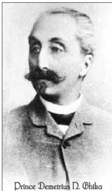
Fig. nr. 2 – Prințul Dimitrie Ghika – Comănești

Prințul era doctor în drept, magistrat și deputat. A călătorit foarte mult ca cercetător științific plin de inițiativă și pasiune și vânător iscusit. Călătoriile sale acoperă arii întinse din Europa, Asia și Africa. Dar faima și renumele de om științific de nivel european i-a adus-o expediția organizată de el și fiul său Nicolae în anii 1895 – 1896 în Cornul Oriental al Africii, unde a cercetat relieful, hidrografia, flora, fauna și a făcut interesante observații asupra așezărilor și locuitorilor acestora. Datele, inedite aproape în totalitate, au fost foarte apreciate în lumea științifică. Rezultatele comunicate sau publicate au fost preluate de savanți ca I. M. Hilderbrandt și prof. dr. Phillip Paulitschke. Ultimul a remarcat entuziasmul patriotic care l-a determinat să boteze cu nume românești forme de relief.