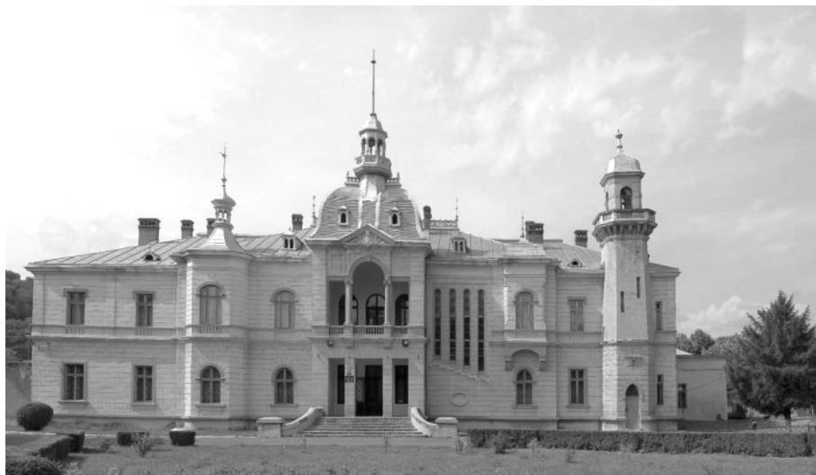
Fig. nr. 1 – Palatul „Dimitrie Ghika” – monument arhitectonic